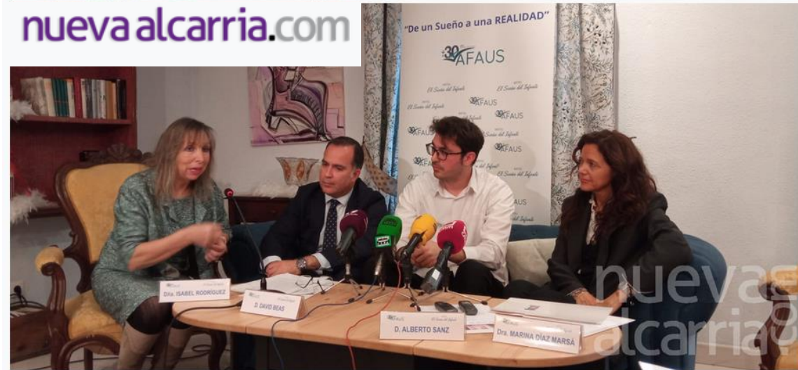
El hotel El Sueño del Infante, referente de integración de personas con trastorno mental