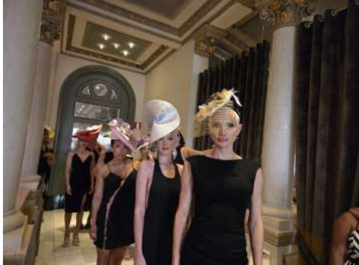
REPLICA SHISMO 2025